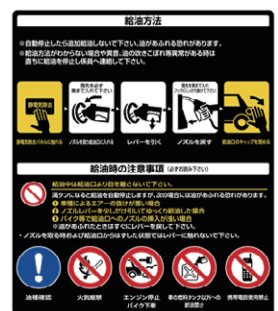
図3 計量機の表示例

なお、下記の消防庁ホームページに関連情報を掲載していますので、これらを参考に安全に給油するようお願いいたします。